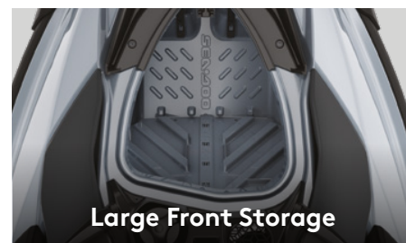
Large Front Storage

Корпус Polytec™ второго поколения специально разработан для активного отдыха. Материал корпуса Polytec GEN 2 очень прочный и хорошо защищен от царапин, а также его использование способствует снижению общего веса гидроцикла и улучшению динамических характеристик.