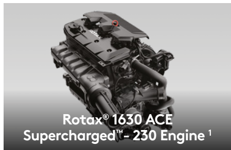
Rotax® 1630 ACE Supercharged™ - 230 Engine 1

Rotax® 1630 ACE Supercharged™ — двигатель, оснащенный нагнетателем и промежуточным охладителем. Он оптимизирован для работы на бензине с октановым числом 95, что позволяет заметно снизить расходы на топливо.